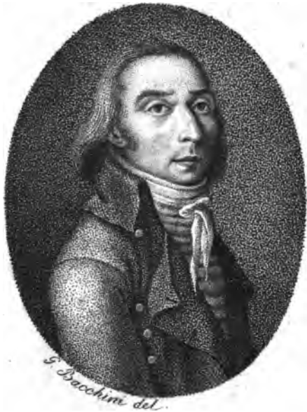
GIO. DOM. ANGUILLES CO I